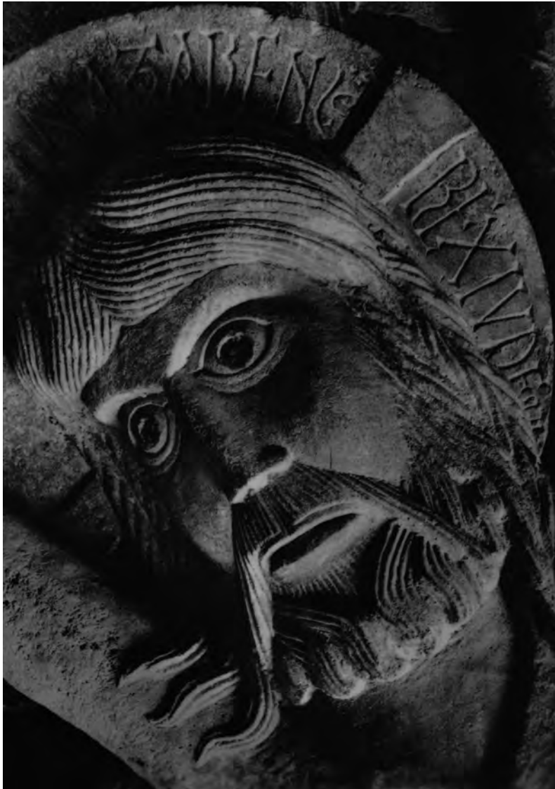
Christus en Tomas (detail), Santo Domingo de Silos, twaalfde eeuw

was dan ook geleidelijk uitgebreid tot een groot gebied van aan de grens met de Nabateeërs in het zuiden tot ver boven het meer van Galilea in het noorden. Maar door moorddadige intriges om de macht binnen de dynastie en door het doortastende ingrijpen van de Romeinen, die de herodianen als trouwe marionetten aan zich wisten te binden, werd een einde gemaakt aan deze periode. Het heimwee en het verlangen naar een zelfstandig rijk waarin God zijn verbond met Israël definitief vorm zou geven, raakten echter niet uitgedoofd. Integendeel, hoe groter de frustratie, des te heftiger ook de drang om van een nieuw koninkrijk te dromen. De Romeinen verstonden wel de kunst de Joden een groot aantal religieuze en economische privileges te schenken en hen op die manier aan zich te binden,