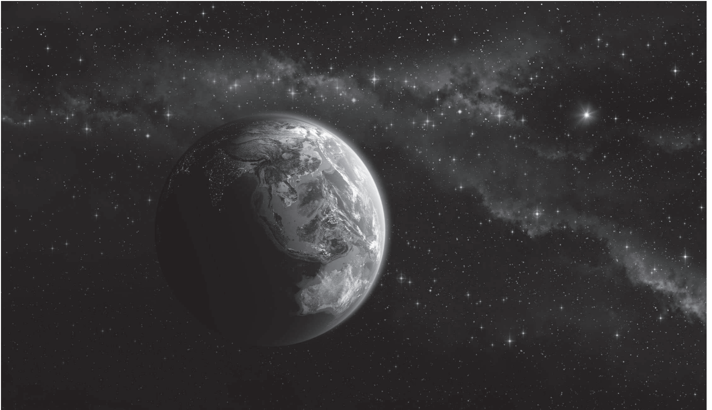
Prediker zag de aarde nooit vanuit de ruimte

punt. Hij bouwt vervolgens ook (enige) betekenis op. Hij ontdekt enkele paradoxale waarheden; dat wil zeggen: hij ontdekt dat er meer waarheden naast elkaar kunnen bestaan. Elkaar tegensprekende waarnemingen kunnen tegelijk waar zijn. Afhankelijk van de periode in je leven waarin je zit. Afhankelijk van de context. Afhankelijk van de omstandigheden, en van de tijd ('Er is een tijd om te baren en een tijd om te sterven ..., een tijd om af te breken en een tijd om op te bouwen ..., een tijd om te omhelzen en een tijd om af te weren.'). Afhankelijk van de schaal of het niveau waarop wij denken. Wat desastreus kan zijn voor iemand op individueel niveau (niet alleen de individuele mens, maar ook de afzonderlijke plant of het ene dier), kan vanuit het perspectief van de soort of de groep heilzaam zijn. Als je begint met kijken naar de wereld op het niveau van de individuen, ziet hun betekenis er heel anders uit dan wanneer je kijkt naar die betekenissen op het niveau van de species, habitat of complexe samenleving. De niveaus zijn niet tegen elkaar weg te strepen. Wat op het ene niveau inadequaat kan zijn of waardeloos, kan op een ander niveau uiterst geschikt, toereikend of tijdelijk voldoende zijn. Het lastige voor mensen is alleen dat ze niet gelijkij-