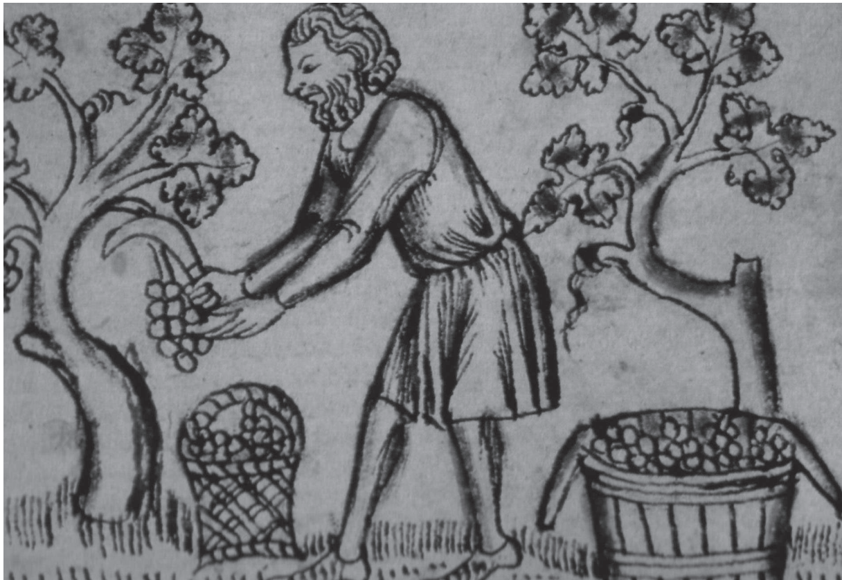
Uit het kalendarium Breviari d'Amor : het genieten van de oogst, Valencia, vijftiende eeuw, Biblioteca Nacional de España

straf, maar ik zag dat degenen die anderen het leven zuur maken, hen bedriegen en vermoorden, het toch voor de wind gaat (...) Ik zag dat een rechtvaardige die zijn leven lang gewerkt heeft, zijn geld naliet aan zijn kinderen, die het geld er in een mum van een tijd doorheen joegen, verbrasten.' Daarom gaat Prediker zelf op zoek naar wijsheid. De resultaten van deze eigen waarnemingen (het zien) moeten die van de overlevering (het horen) vervangen.