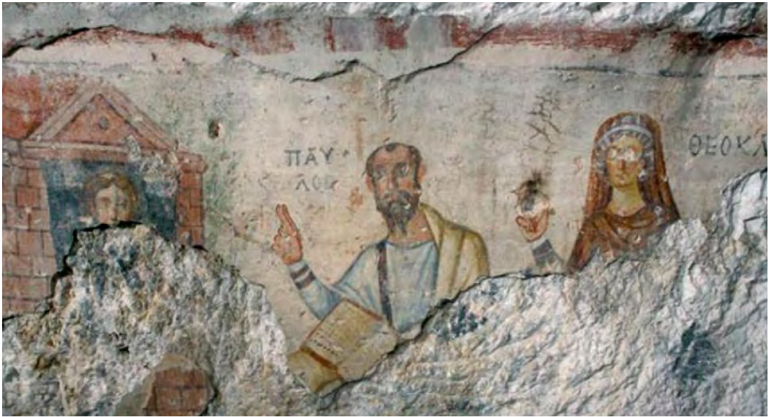
Uit de grot van Paulus te Efeze. Een van de oudste, zo niet dé oudste afbeelding van Paulus, hier geportretteerd met Thecla aan zijn zijde.

De namen Demas en Hermogenes zijn afkomstig uit 2 Timoteüs (1,15 en 4,10) en net als daar zijn zij hier tegenstanders van Paulus. Dit is dus wederom een punt van overeenkomst tussen de Handelingen van Paulus en Thecla en 2 Timoteüs. Een andere overeenkomst is dat de leer dat de opstanding al heeft plaatsgevonden in beide teksten voorkomt en wordt toegeschreven aan de tegenstanders van Paulus. In 2 Timoteüs 2,18 horen we dat sommigen van hen 'van de waarheid zijn afgedwaald' door 'te beweren dat de opstanding al heeft plaatsgevonden'. In de zojuist geciteerde passage uit de Handelingen van Paulus en Thecla wordt hier echter ook nog aan toegevoegd dat deze opstanding verkregen wordt 'in onze kinderen'. Dit lijkt sterk op het eerder al besproken idee dat redding verkregen kan worden door het baren van kinderen, hetgeen gepropageerd wordt in 1 Timoteüs 2,15. Maar daar waar dit idee in 1 Timoteüs aan Paulus wordt toegeschreven, daar vinden we het in de Handelingen in de mond van de tegenstanders van Paulus. De ideeën van 1 Timoteüs